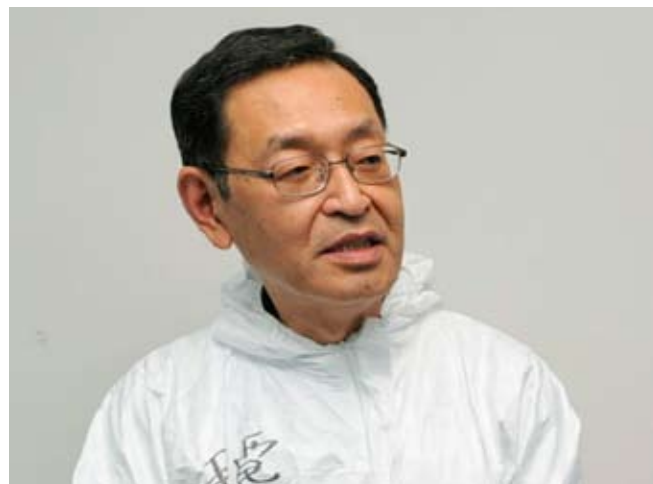
Masao Yoshida, 17 Feb. 1955 — 9 Julio 2013

Los trabajadores deben ser relevados tras alcanzar las máximas dosis radiactivas permitidas. Se calcula que pasan por Fukushima unos 11.000 trabajadores al año. En un país como Japón con un índice de paro muy bajo (antes del tsunami era el 4%) es difícil conseguir trabajadores que se jueguen la salud en el control de la radiactividad. Se han presentado denuncias sobre la contratación de indigentes y también sobre el hecho de que ha sido la yakuza japonesa la encargada de realizar las contrataciones. Así, pues, esos primeros héroes han sido sustituidos por mendigos, desempleados sin recursos, jubilados en apuros, personas endeudadas o jóvenes sin formación. Las diferentes tareas se subcontratan, con lo que es casi imposible mantener un control sobre las condiciones de los trabajadores. De hecho, una investigación de la agencia Reuters localizó hasta 733 empresas ejerciendo como subcontratas en la zona. Se trata de conseguir beneficiarse del accidente y de conseguir parte de los 75.000 millones de euros que serán invertidos en recuperar la zona en los próximos años. Ha habido múltiples denuncias de irregularidades: los trabajadores sólo cobran los días que trabajan, no tienen seguro médico, son obligados a pagar su propia comida y hasta a pagar su propia máscara. Tal acumulación de denuncias debería, por lo menos, provocar una investigación del gobierno.