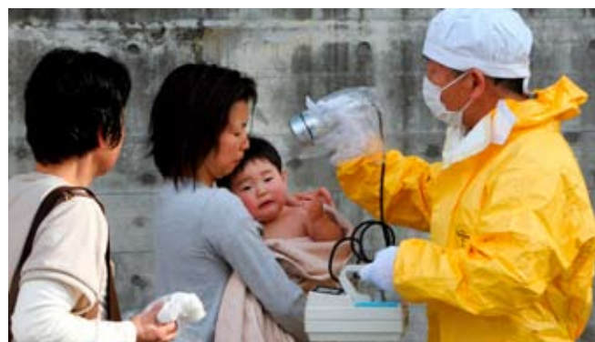
1. La escala INES (International Nuclear Event Scale) se instauró por el Organismo Internacional de la Energía Atómica (OIEA) para tratar de objetivar la comunicación de la gravedad de los sucesos nucleares y va de 0 (incidencia) hasta 7 (accidente muy grave con salida masiva y dispersión a larga distancia de material radiactivo). La existencia de la escala INES, dado su carácter caritativo, no ha conseguido objetivar los debates sobre la gravedad de los sucesos nucleares y menos aún sobre el riesgo nuclear.