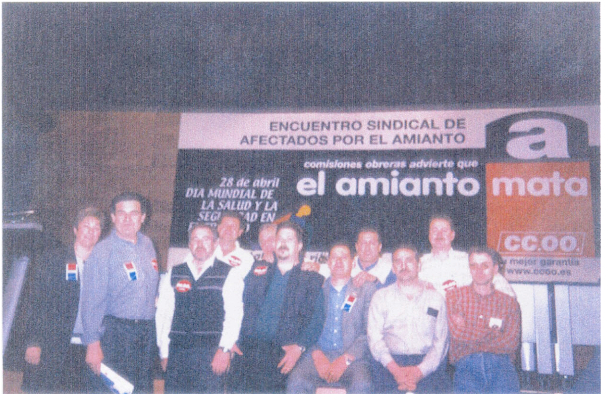
Trabajadores de CAF de Zaragoza

El 3 de Junio, una delegación de CCOO, mantiene una entrevista con la Ministra de Sanidad, Celia Villalobos. Se acuerda adelantar la ley sobre prohibición del amianto, a Diciembre de 2001 , respecto al 31 de Diciembre del 2005, que se tenía previsto por parte del Gobierno.